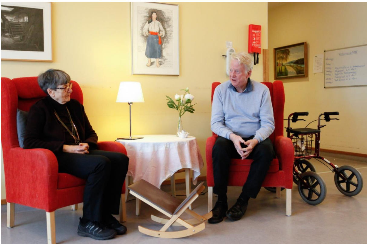
Figur 1. Kvinna och man på äldreboende.

Särskilt boende för äldre är en behovsprövad boendeform enligt Socialtjänstlagen. Kommunerna är enligt 5 kapitlet 5 § i Socialtjänstlagen skyldiga att tillhandahålla särskilda boendeformer för service och omvårdnad för äldre som behöver särskilt stöd.