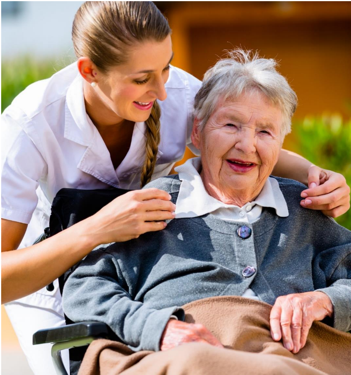
Figur 3. Äldre kvinna i trädgård med sköterska.

av en äldre karaktär påverkar utbudet på funktionsanpassade lägenheter med tillgång till hiss och vitvaror som till exempel tvättmaskin i lägenheten vilket minskar förmågan till självständighet.