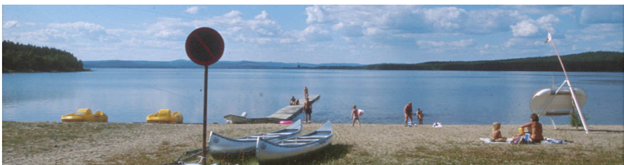
Storsands Camping