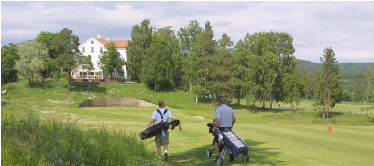
Ånge Golfklubb, Hussborg