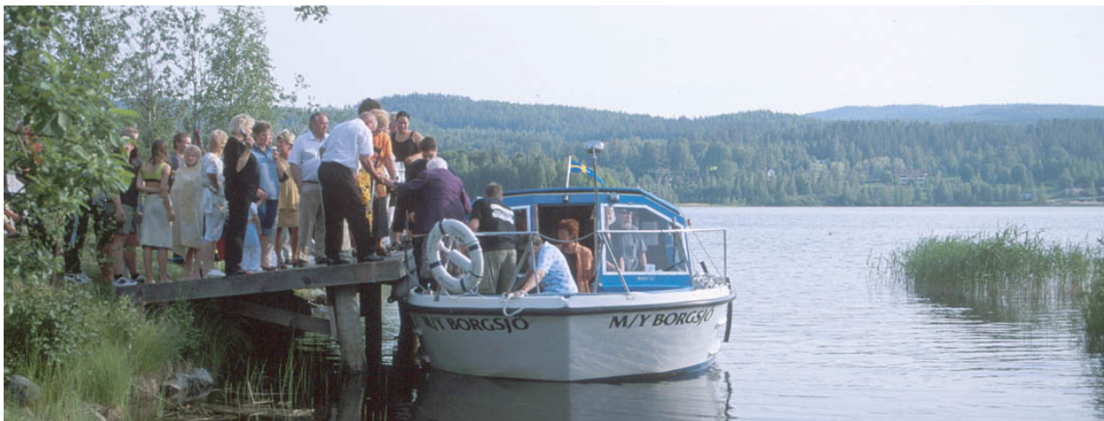
M/Y Borgsjö