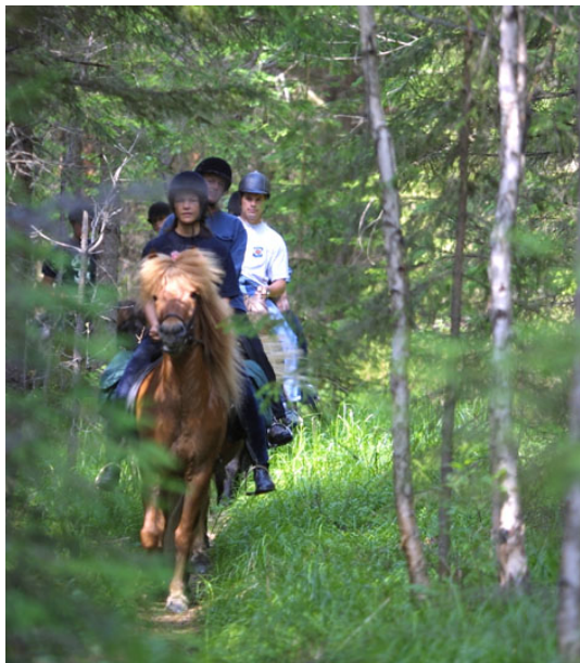
Hussborgs Islandshästar