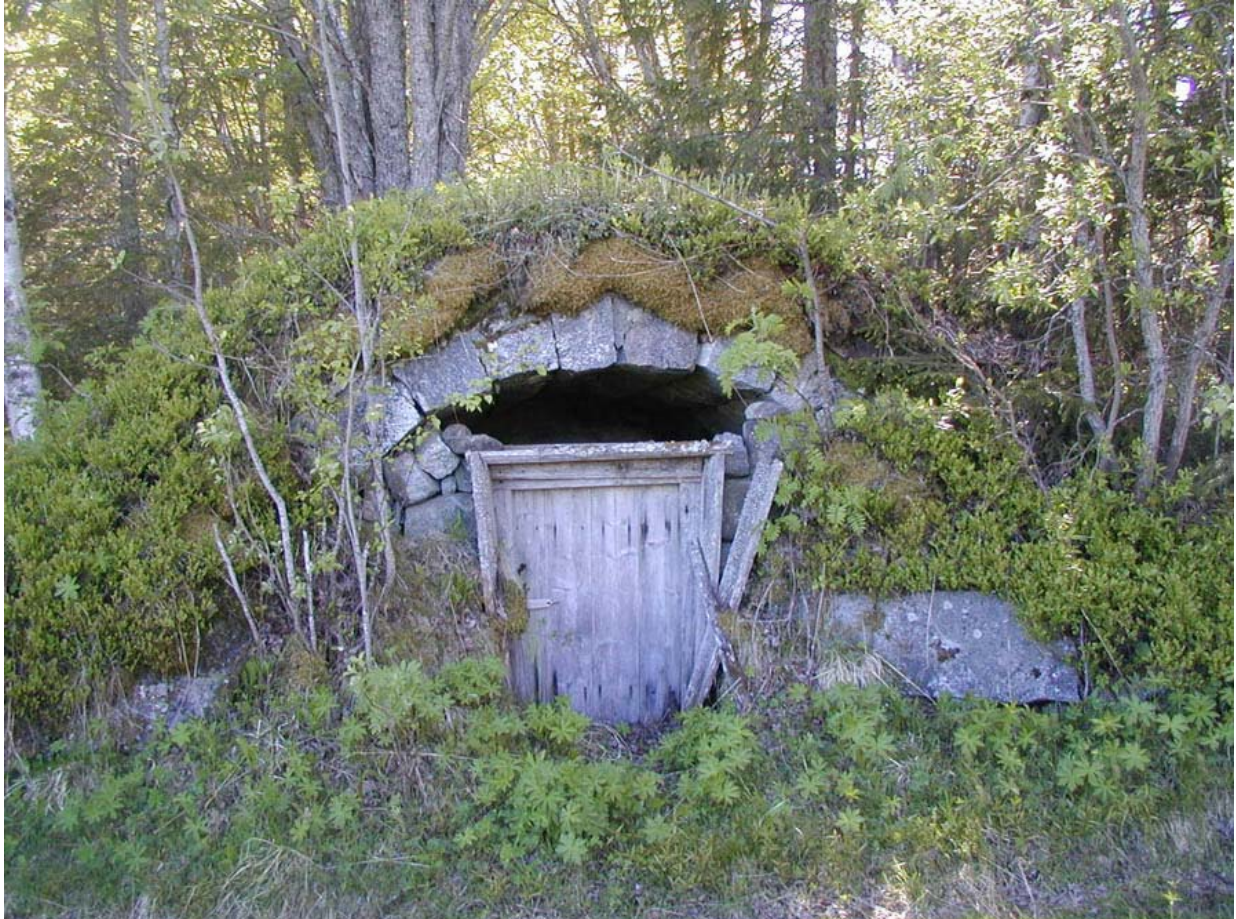
Gammal potatiskällare i Julåsen

med högt kulturvärde, dessa byggnader inritas på aktuell ekonomisk karta och förs till supplement översiktsplan. Under detta arbete beskrivs också möjliga åtgärder, restaureringar mm, för att ge översiktsplanen som bas ett innehåll motsvarande ett åtgärdsprogram kulturmiljövård.