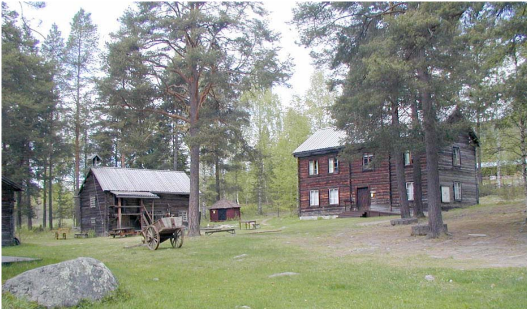
Jämtkrogen vid Borgsjö Hembygdsgård

Under detta arbete beskrivs också möjliga åtgärder, restaureringar mm, för att ge översiktsplanen som bas ett innehåll motsvarande ett åtgärdsprogram kulturmiljövård.