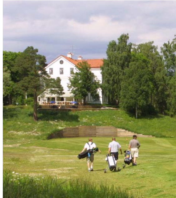
Hussborg omges av Ånge Golfklubbs bana

En förutsättning för ett bevarande är att vid åtgärder och renovering av befintlig bebyggelse bör varsamhet iakttas så att byggnadernas exteriör ej förvanskas. Området runt om Hussborg bör hållas vid hävd.