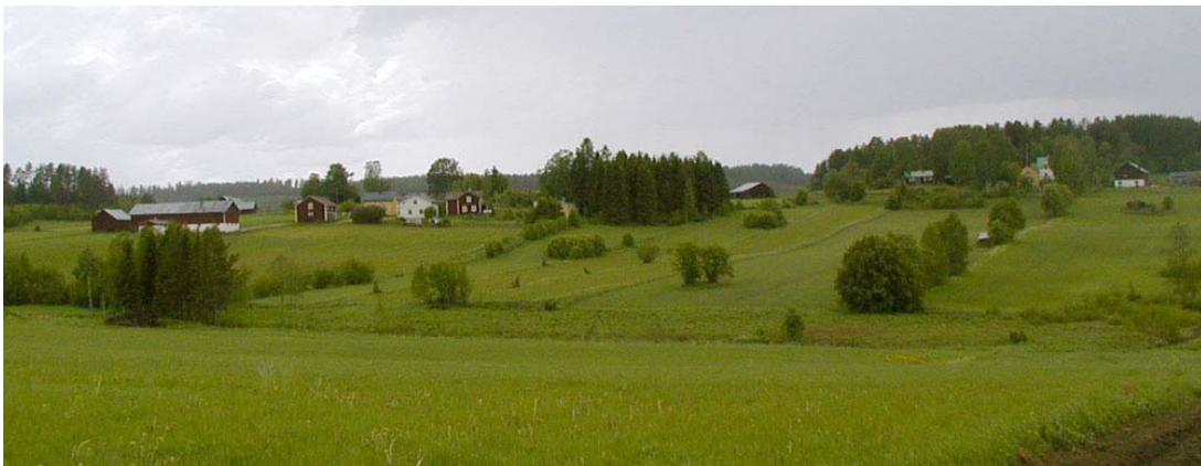
Hjältan ligger mitt i ett odlingslandskap

västra delen av byn ligger tre välbevarade gårdsanläggningar troligen uppförda runt sekelskiftet eller början på 1900-talet. Mangårdsbyggnaderna är av halvkors-typ. Till gårdsanläggningarna hör bagarstugor, ladugårdslängor och andra ekonomibyggnader.