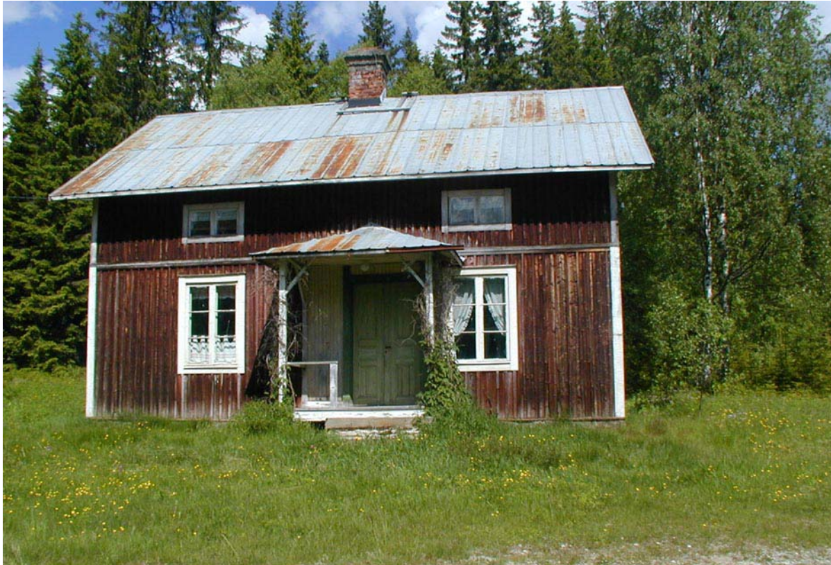
Per-Albin torp i Norra Stormörtsjön