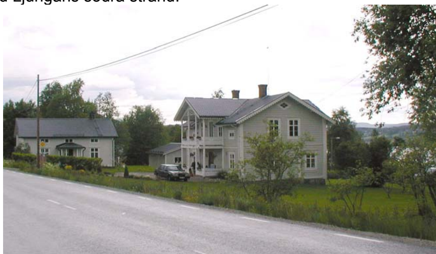
Fastighet i Finnsta

Bebyggelsen är från 1800- och 1900-talet. Bebyggelsen finns på båda sidorna byvägen med ettlandskap som sluttar ner mot Ljungan. Byn har ett antal välbevarade gårdsanläggningar. Här finns salsbyggnader med tillhörande sommarhus, bagarstugor och ekonomibyggnader. Här finns också timrad ladugård, härbre och logar. Odlingslandskapet är tämligen väl hävdad. Området visar upp en enhetlig bebyggelsestruktur där falu rödfärg dominerar. Det domineranden fasadmaterialet är liggande fasspont.