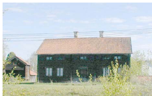
Ångebyn vid väg 83

Det ena området ligger väster om kyrkan och berör själva Ångebyn. Det andra är området runt kyrkan med intilliggande byggnader.