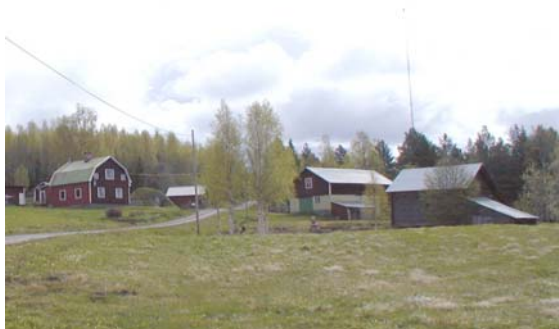
Snöberg. Hus på ena sidan vägen, ladugård på andra var vanligt förr

Snöberg består av en jordbruks-bebyggelse från 1800-talet som ligger väl samlad på berget. Odlingslandskapet är öppet och ligger på sluttningarna vid sidan om vägen.