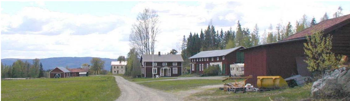
Byvägen genom Granboda

Bebyggelsen ger trots en del fasadförändrade bostadshus ett välbevarat och enhetligt intryck. Odlingslandskapet hålls idag öppet vilket påverkar det positiva intrycket av hela bymiljön.