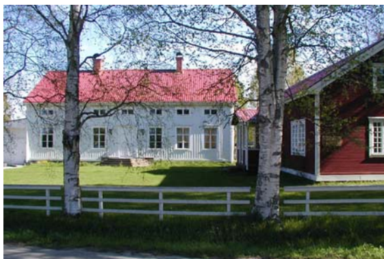
Ångströmsgården i Ångebyn