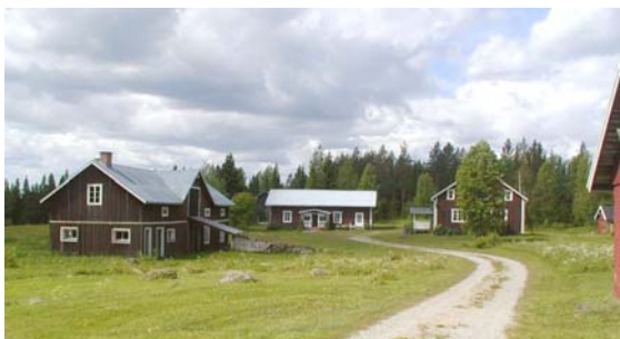
Gård i Södra Stormörtsjön

Södra Stormörtsjön var och är en utpräglad skogsby där den ligger vid Stormörtsjöns södra sida. Byn består av fyra gårdsanläggningar uppförda under 1800-1900 talet. Den östra gårdsanläggningen består av en torparstuga med tillhörande ekonomibyggnad. Den övriga bebyggelsen i Södra Stormörtsjön är något förändrad men ger en prägel av 1900-talets byggnadsskick. Odlingsmarken är igenplanterad med skog.