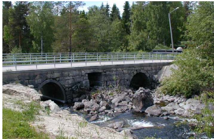
Stenvalvsbron i Rombäck

vid anläggandet av nuvarande väg E14 delats i två delar norra och södra delen. Södra delen präglas av välhävdad mark. Här finns också en vacker stenvalvsbro över ån som mynnar i Ljungan.