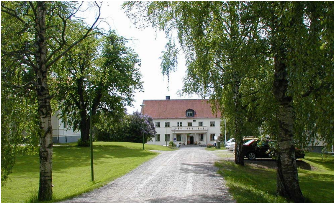
Ålsta Folkhögskola grundades 1872

inritas på aktuell ekonomisk karta och förs till supplement översiktsplan. Under detta arbete beskrivs också möjliga åtgärder, restaureringar mm, för att ge översiktsplanen som bas ett innehåll motsvarande ett åtgärdsprogram kulturmiljövård.