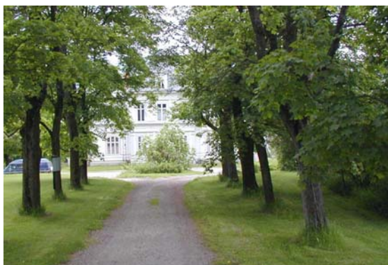
Sekelskifteshus med park i Fränsta