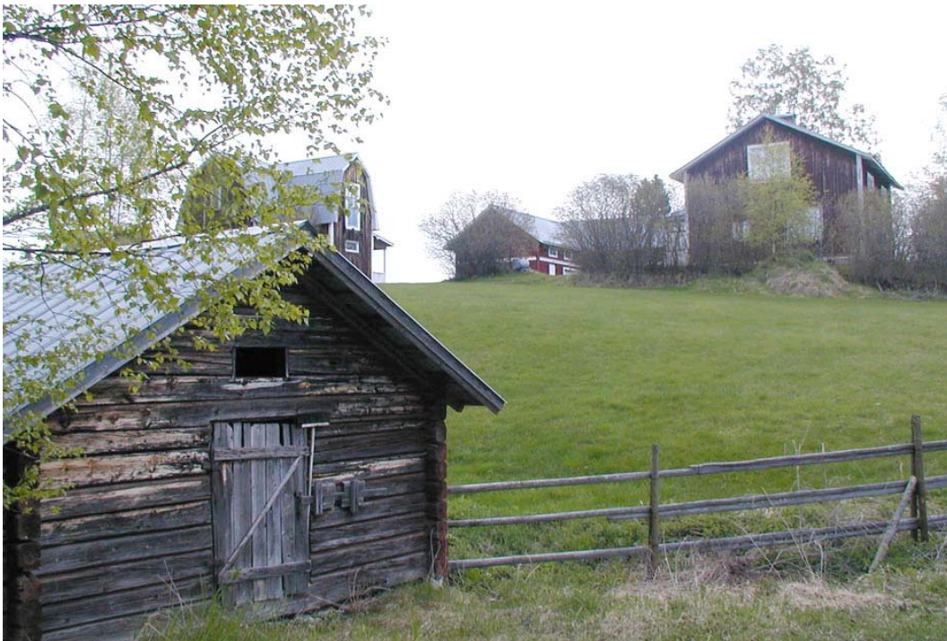
Gård i Holmsnäset