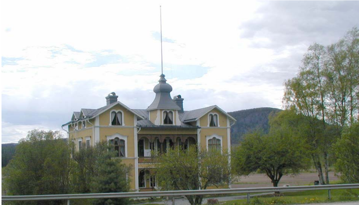
Del av byggandsminne i Ö

översiktsplanen som bas ett innehåll motsvarande ett åtgärdsprogram kulturmiljövård.