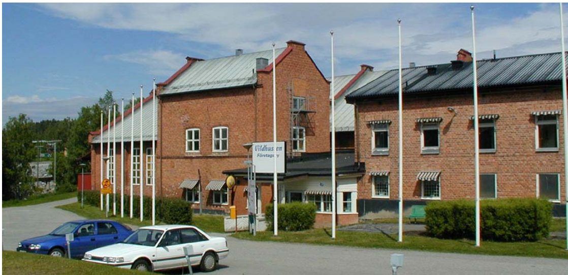
Torpshammars bruk är idag företagshotell, Vildhussens företagsby

Torpshammar uppvisar en blandad bebyggelse. Här finns allt från byggnader från 1900-talets början till 1940-talets flerfamiljhus. Industrianläggningen f.d. trämassefabriken består som bas av två äldre byggkroppar som byggts om och till under åren. Den norra byggnaden med tärspröjsade fönster tyder på att den uppfördes vid sekelskiftet. Byggnaderna är uppförda i tegel, gavlarna är dekorerade med tegeldecor det finns höga spröjsade fönster och taket är av plåt. Mitt emot industrianläggningen ligger den gamla herrgården uppförd 1808. En bred byggnad med valmat – och brutet tak och väggar i vit liggande panel.