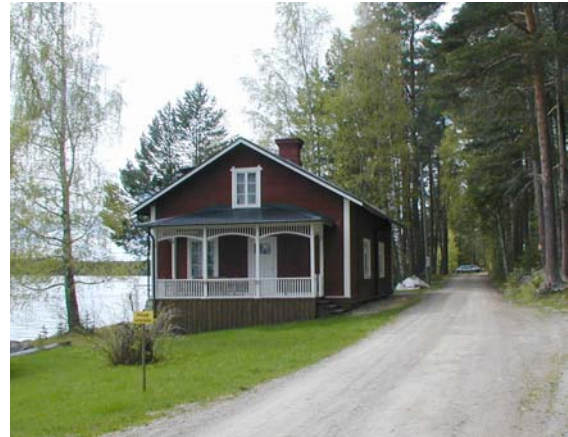
Grannhuset till museet ett hus som tidigare tillhörde flottningsföreningen