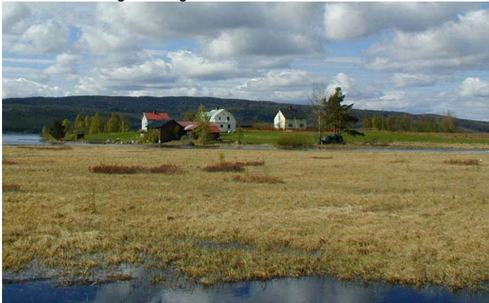
Holmsnäset, Foto: Ånge kommun, Jonsson o Ullstein

Småjordbruksbyarna som finns i socknen. Sommarstugebebyggelsen är ringa inom området. En alltför stor etablering av fritidsbebyggelse ger en negativ inverkan på den speciella miljön.