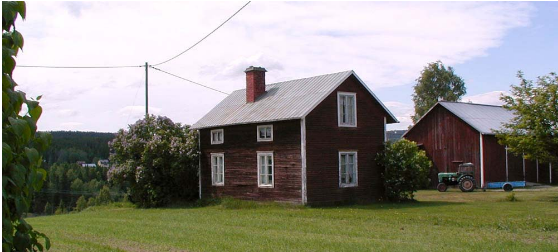
Gård i Boda

Gårdsanläggningarna är relativt välbevarade med gårdstun vid god hävd. Till gårdsanläggningarna hör mangårdsbyggnader, bagarstugor, ladugårdslängor och andra ekonomibygnader.