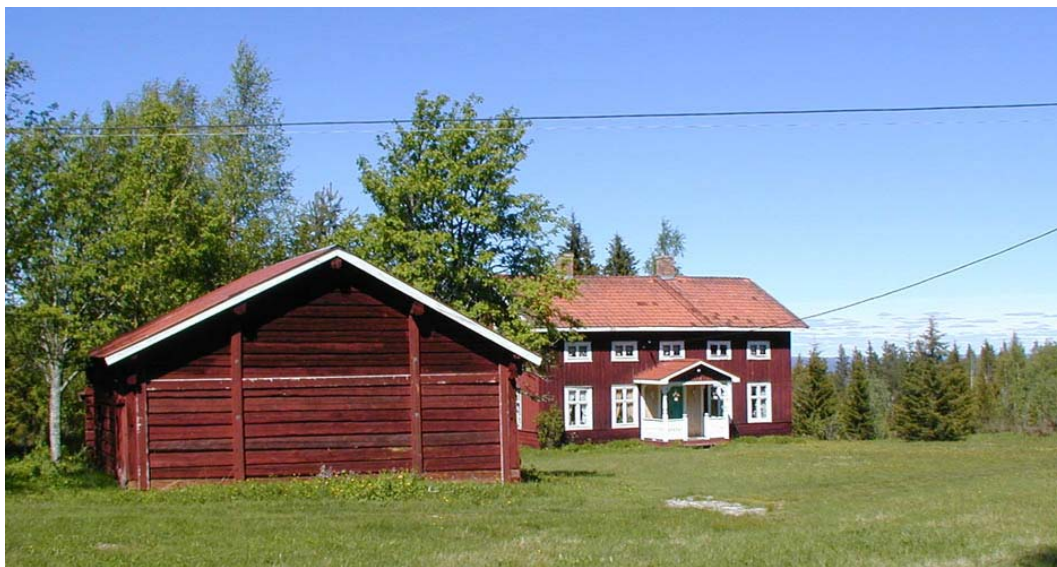
Gård i Julåsen

Julåsen är en högt belägen finnby med spridda gårdsenheter utefter byvägen. Byn består av framförallt jordbruksbebyggelse från 1800- och 1900-talet. Byn ligger mitt i skogsmark. Hävdad mark finns inom delar av byn. Flera av mangårdsbyggnaderna har ett hel- och halvkorsformigt grundplan. Centralt mitt i byn finns en bevarad helkorsbyggnad. Vid Bäcketorpet finns två s.k. Per-Albin torp bevarade. Vid Nedergårdarna finns en välbevarad enkelstuga med ursprunglig exteriör, bred lockpanel med smidda spikar. Till gårdsanläggningen hör också ladugårdslängor, härbren, bodar och andra ekonomibygnader. Centralt i byn finns en skola från 1920-talet. Marken nyttjas endast för höfoder?