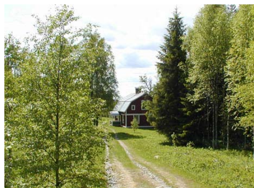
Gård som används som fritidshus i Oxsjön