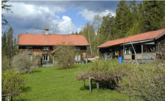
Gårdsmiljö i östra Lombäcken, fint tun många byggnader innanför stängsel

innehåll motsvarande ett åtgärdsprogram kulturmiljövård.