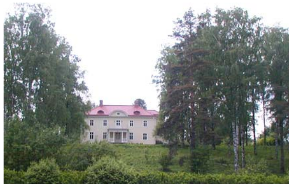
Disponentvillan i Ljungaverk

Miljö nr 8 ligger omedelbart söder om E-14 och norr om järnvägen. Detta område har legat utanför fosfatbolagets egendom, men bebotts av anställda vid bolaget. Området är en s.k. utlöpare från jordbruksbebyggelsen i Västerhångsta. Fastigheterna är i huvudsak uppförda under 1910-20-talen. Miljö nr 9 ligger norr om Ljungan omedelbart väster om bron. Miljön består av två fastigheter. På den ena fastigheten står "ingenjörsvillan" uppförd år 1915 i trä och med locklistpanel. Den andra fastigheten består av tre stycken flerfamiljshus uppförda under 1940-talet och 1955. De äldre flerfamiljshusen uppfördes för arbetare vid Svenska Gummi Fabriken vilken verkade under andra världskriget. Verksamheten lades ner efter krigsslutet. Det tredje flerfamiljshuset uppfördes under Fosfatbolagets sista expansionsperiod på 1950-talet.