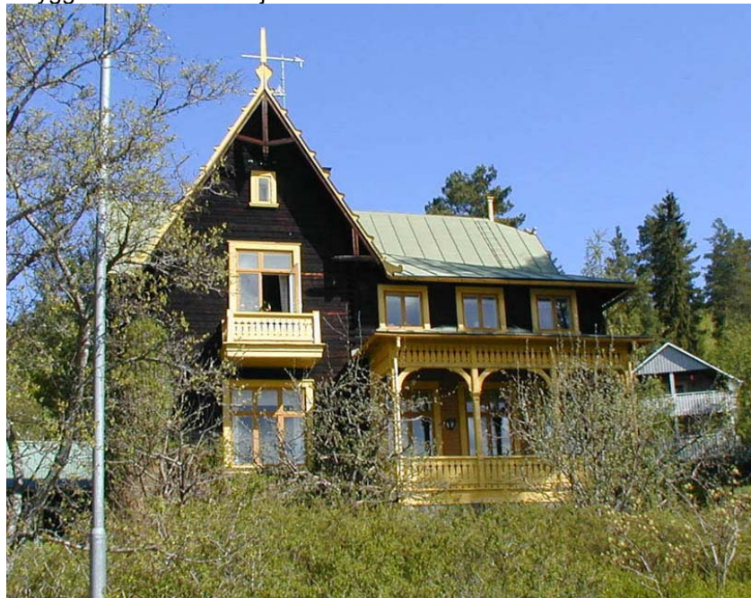
Fastigheten på Bergsgatan föreslås som lokal kulturmiljö.