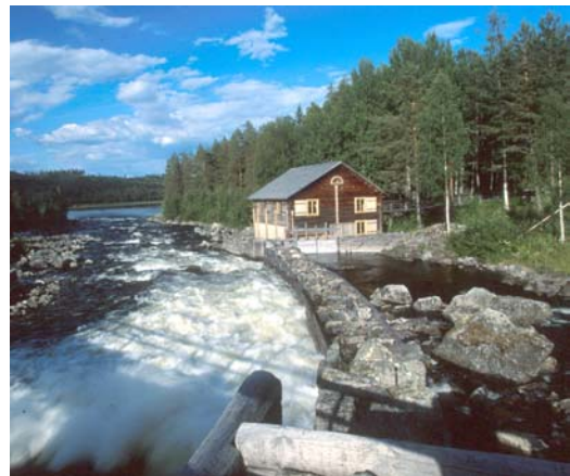
Kvarnen, Foto: L Milling

förekommande i form av ledarmar, dammar och rännor. Inom området har också pågått ett intensivt fiske. I Sörströmmen finns rester av ett fiskehus som troligen använts vid ålfångst. Kvarnen som ligger i Sörströmmen är förhållandevis väl bevarad. Den har fungerat i 90 år.