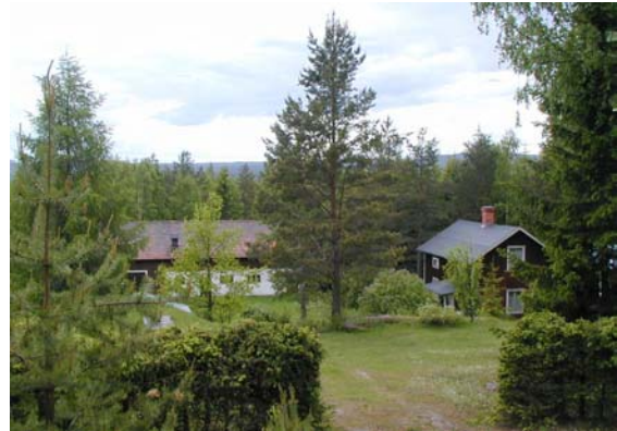
Gård i Kälen