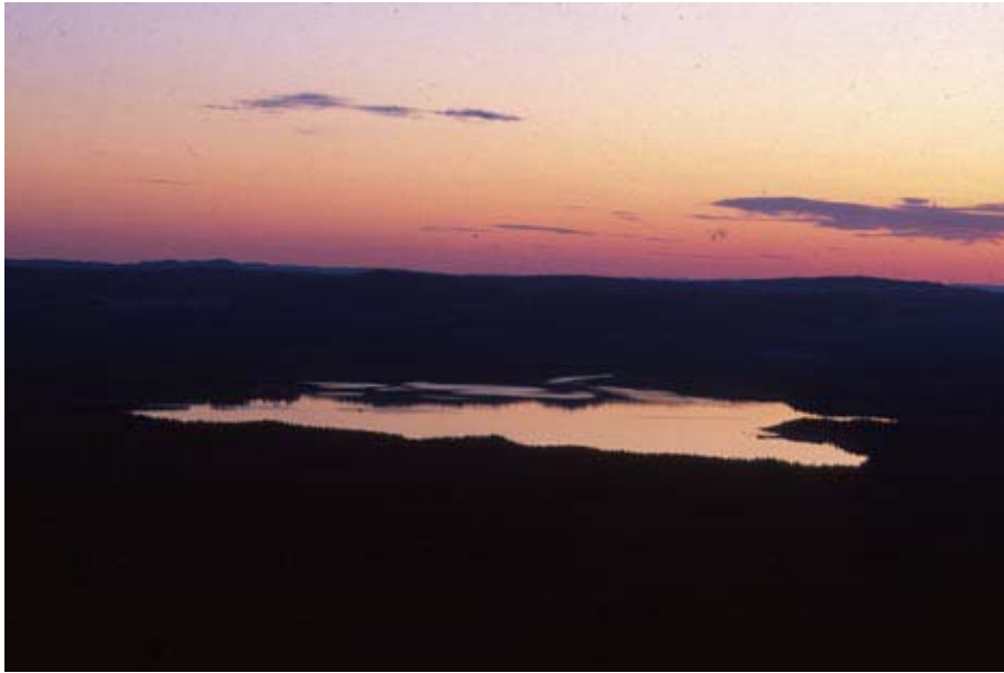
Munkbysjön i skymning

tradition skall en kyrka eller ett kapell ha funnits i byn. Byn är en utpräglad s.k. jordbruksby belägen runt Munkbysjön. Bebyggelsen är uppförd under 1800-talet och 1900-talets första hälft. I byn finns ett flertal byggnader med korsplan. Här finns även härbren.