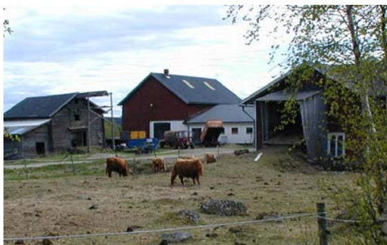
Vy från affären, bondgård med betande highland cattle

Odlingslandskapet och jordbrukets byggnader breder ut sig ned mot Ljungan. Den äldsta bebyggelsen finns i sydvästra delen av byn längs den gamla vägen mellan Vassnäs och Medingen. Här finns också byggnader med olika servicefunktioner från 1800talets senare del och 1900-talets början. I den äldre delen av byn finns två korsbyggnader från 1850-talet. En timrad parstuga, rödmålade eller obehandlade ladugårdar, logar, härbren och stallar präglar denna del av byn.