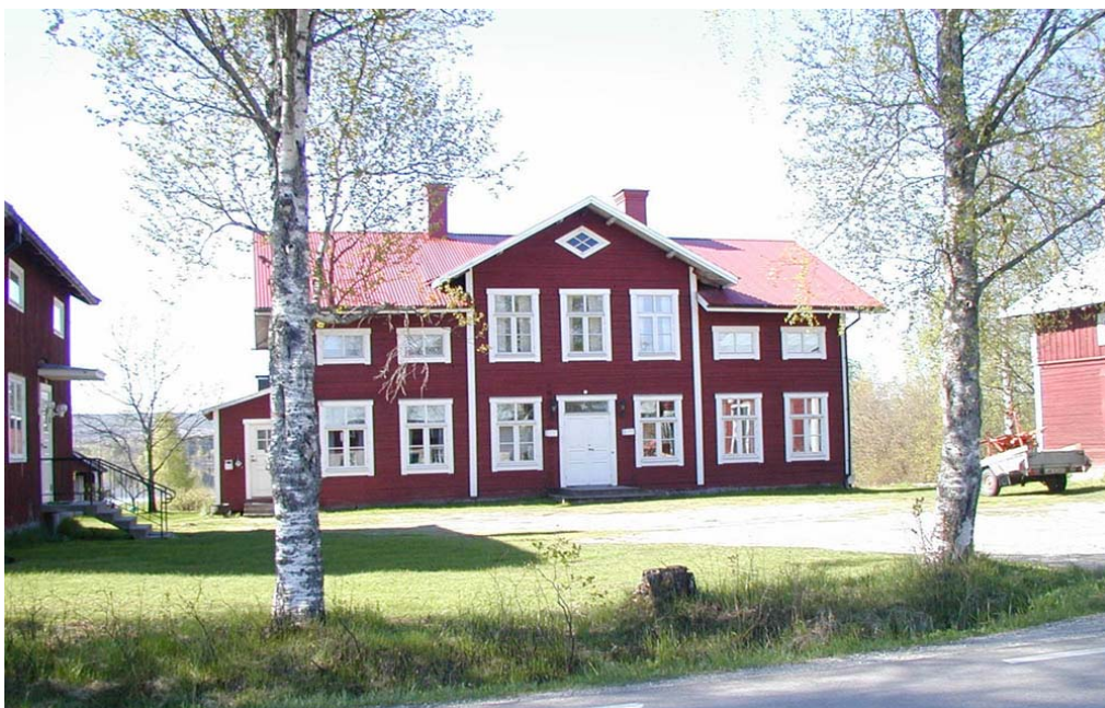
Ångströms gård i Ångebyn