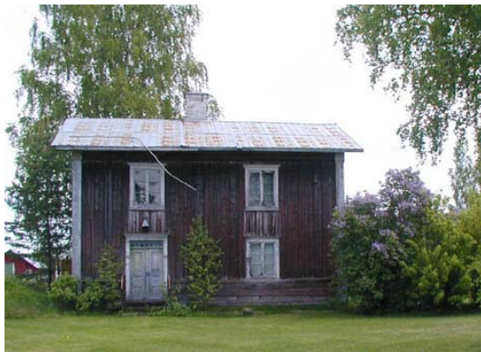
Föreslås ingå i lokal kulturmiljö