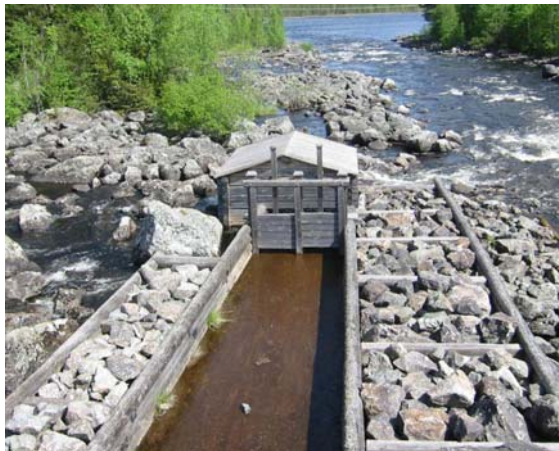
Fiskehus, Foto: Ånge kommun, J Grelsson

Vid Haverö strömmar har älven en fallhöjd på 5 meter ned till sjön Medingen. Här har älven tre flöden: Kvisslebäcken, Norrströmmen och Sörströmmen. Här finns regleringsdammarna kvar som minner om flottningsepoken. Norrdammen är den äldsta med dammluckor från seklets början. Dammluckorna regleras för hand och är intressanta från teknik- och industrihistorisk synpunkt.