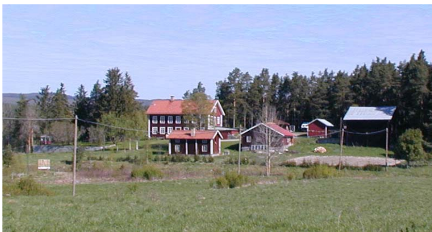
Holmbacken i Ångebyn