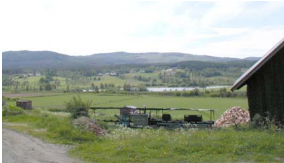
Utsikt från Gullgård mot Ljungan