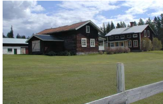
Gård i Lombäcken, Foto: Ånge kommun, Jonsson o Ullstein

Lombäcken utgör en typisk miljö för sin tids byggnadsskick med rödmålade eller omålade fasader i liggtimmer och träpanel. Byn ger ett enhetligt intryck. Ett bevarande kräver att vid åtgärder av befintlig bebyggelse bör varsamhet iaktas.