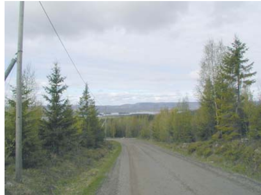
Snöberg, utsikt över Bysjön