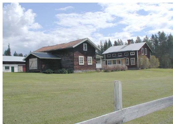
Byggnader i Lombäcken