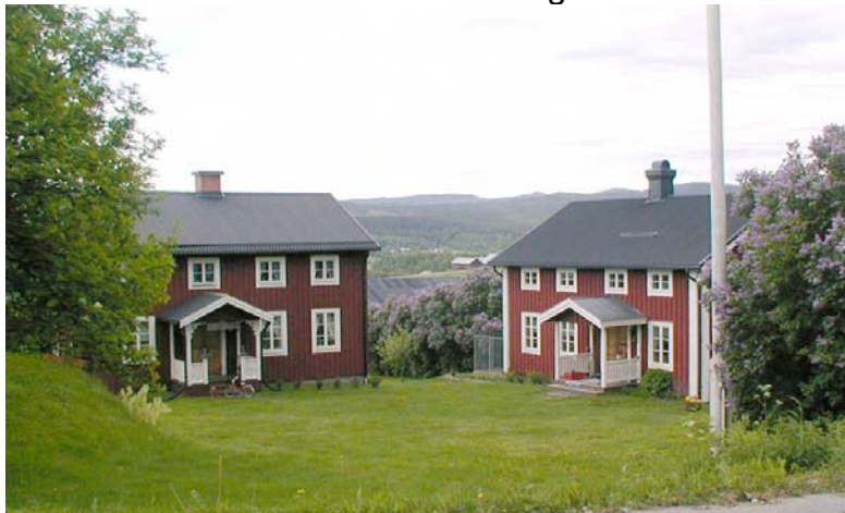
Gårdsanläggning i Gullgård

Gullgård är även i våra dagar en utpräglad jordbruksby som ligger norr om Ljungan. Byvägen går parallellt med E14. Bebyggelsen innehåller ett flertal byggnader med korsformigt grundplan. Här finns logar, härbren och några större ladugårdsbyggnader. Några av korsbyggnaderna är välbevarade och utan panel. De flesta är fasadklädda med färgsättning i rött och gult.