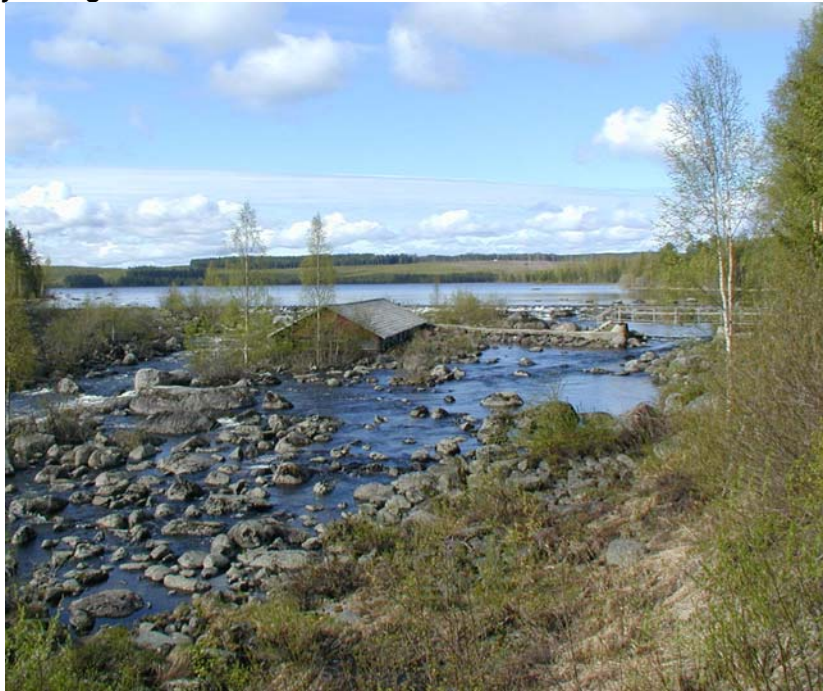
Ålhuset i Aldern

Byggnaden skadades svårt vid vårfloden 1966, men det har under 1970-80-talet renoverats. Idag är detta ålhus det enda i sitt slag i Ljungans älvdal.