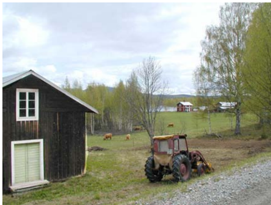
Highland cattle i Märrviken

De två jordbruksfastigheterna i Märrviken ligger på en naturskön plats i slutningen ned mot sjön. På fastigheten Märrviken 1:2 som är den ursprungliga gårdsanläggningen i Märrviken finns ett tiotal byggnader bevarade. De ligger på ursprunglig plats och ger en god bild av de olika funktioner som var nödvändiga på en gård i självhushållens dagar. Här finns en smedja med blåsbälg och eldstad, en bastu för torkning av säd, två ålderdomliga härbren varav en har dörr med hugget rombiskt mönster. Till gårdsanläggningen hör också två stall, två logar, grishus, fårhus, sommarladugård, fölstall, lador och en kombinerad vinterladugård, bakstuga och sommarhus. Den ena mangårdsbyggnaden är en sentida, timrad byggnad med inklädda knutar. Det är en halvkorsbyggnad med snickeriveranda. Drygt en kilometer norr om bebyggelsen finns en välbevarad skvaltkvarn med inskription 1779.