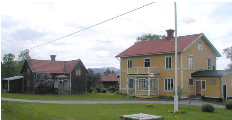
Fastighet i Viken