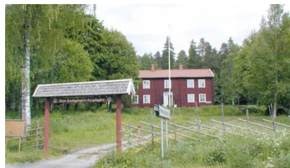
Torps hembygdsgård, Fränsta