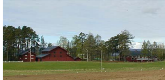
Gård i Byberget

Mangårdsbyggnaderna har varierande utformning. Några är uppförda i timmer och med korsformigt plan. Vid Bysjöns strand finns sentida fritidsbebyggelse.