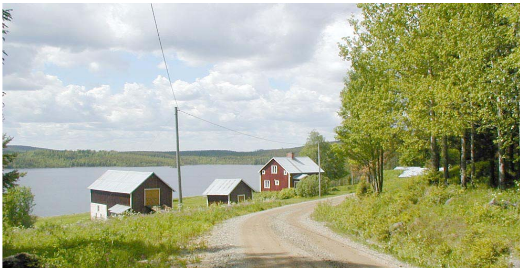
Bebyggelsen ligger längs sjön i Norra Stormörtsjön

Bebyggelsen är framförallt uppförd under 1900-talets första hälft. Fyra av gårdarna är troligen s.k. Per-Albin torp och uppförda under 1920-1930-talet. Bostadshuset är i allmänhet rödmålade. Uthuset är rödmålade eller omålade. Odlingsmarken som hör till torpen ligger i sydslutning ned mot sjön och är delvis vid hävd. Hela byn är även idag speciellt med sitt utdragna läge. Gårdsanläggningarna ligger som ett band efter varandra mellan vägen och sjön. De ger även idag ett genuint intryck och representerar sin tids idela och byggnadsskick.