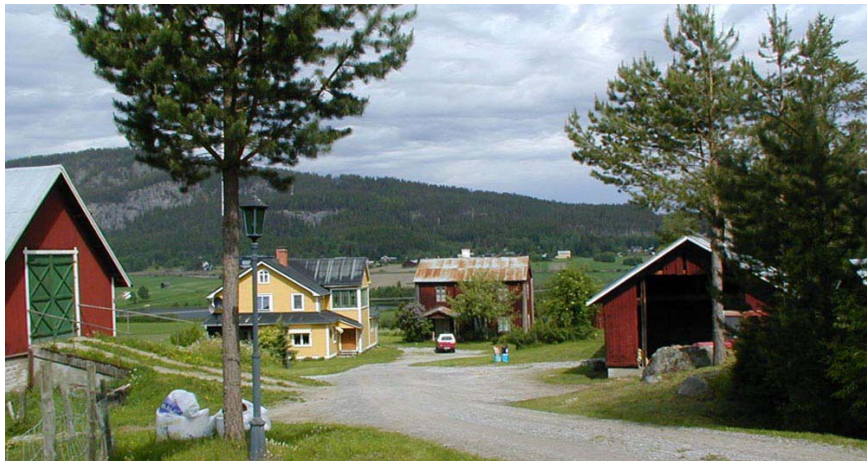
Södra Gullgård, ett bra exempel på 1800-tals bebyggelse

I östra delen av byn finns ett antal välbevarade gårdsanläggningar. Här finns bl.a. en halvkorsbyggnad. Till gårdsanläggningen hör två härbren, loge, bagarstuga och ladugård. Södra Gullgård ger ett genuint intryck av 1800-talets byggnadsstil.