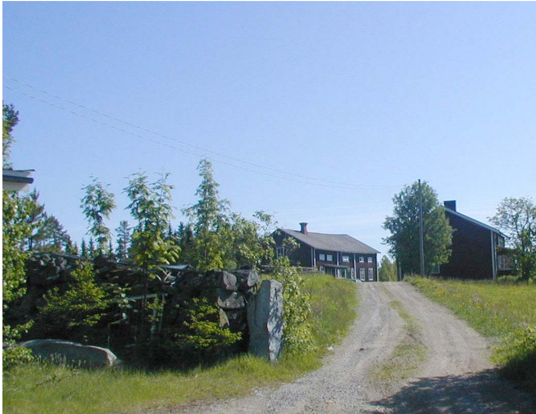
Gård i Råsjö

motsvarande ett åtgärdsprogram kulturmiljövård.