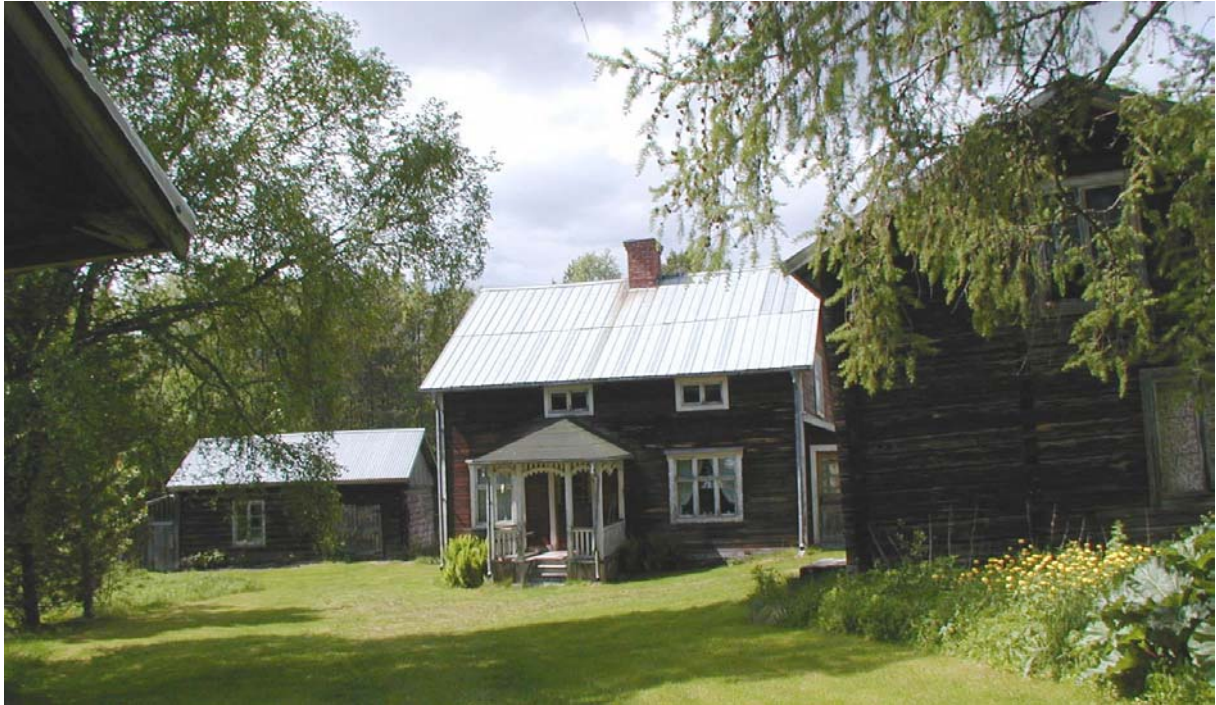
Välbevarad gårdsmiljö