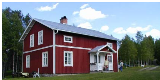
Nyrenoverat hus i Oxsjön

Odlingsmarken är delvis i hävd. Vid en gård har ny hävd av odlingsmark skett. Marken mellan gårdarna dock igenväxt.