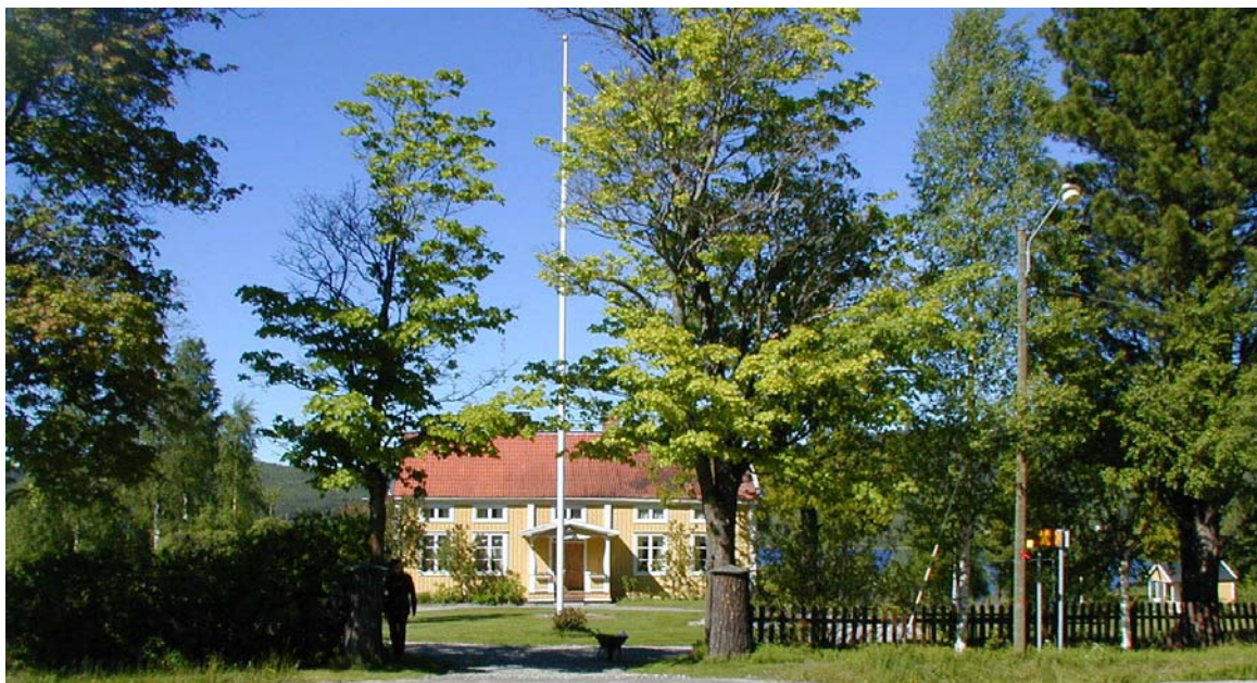
Fastighet i Magdbyn

Magdbyn ligger i ett öppet och bitvis kraftigt sluttande jordbrukslandskap. Centralt i byn ligger flera stora gårdsenheter med stora mangårdsbyggnader, stall och ladugårdslängor samt andra ekonomibyggnader. Bebyggelsebilderna ger ett homogent och väl bevarat intryck med stora mangårdsbyggnader och rödmålade ekonomibyggnader. Stora områden med välhävdat odlingsmark omger byn.