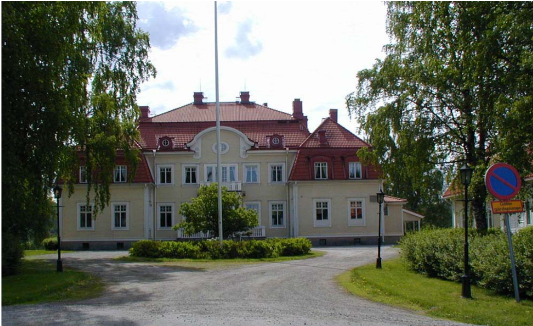
Herrgårdspensionatet i Torpshammar

nya flygelbyggnader. Dessa byggnader är ett mycket bra exempel på hur nybyggnation kan anpassas till äldre byggnader och en speciell kulturmiljö.