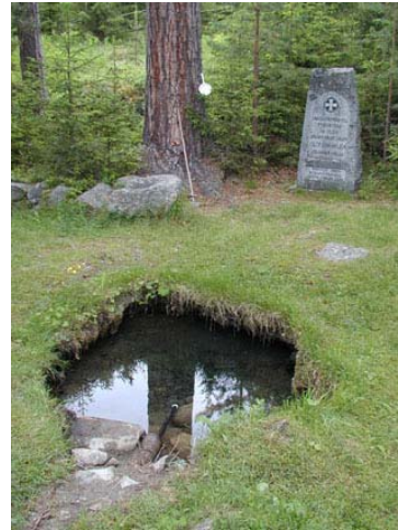
Sankt Olofs källa längs Pilgrimsleden i Borgsjöbyn

Västra delen av Borgsjö by med kyrkan, Borgsjö skans och St Olofs källa är klassat som riksintresseområde. Ett bevarande av hela miljön förutsätter att markerna hålls i hävd.