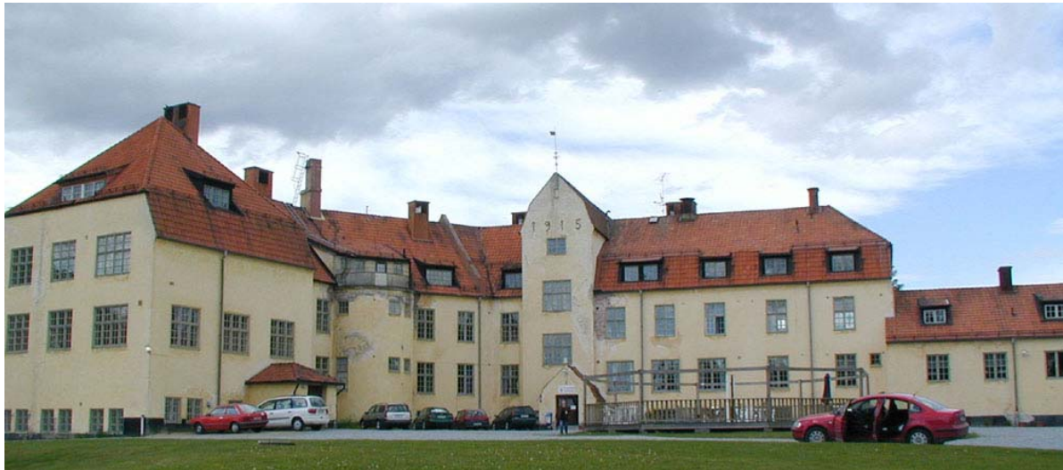
Huvudbyggnaden på Bodaborg

Den östra delen är troligen den äldsta. Byggnaden har en annorlunda utformning uppförd i cirkelform med runda utanpåliggande trapphus och frontespiser. Taktypen är sadeltak och brutet valmat tegeltak. Båda byggnaderna är tämligen välbevarade och kan anses av högt kulturhistoriskt värde.