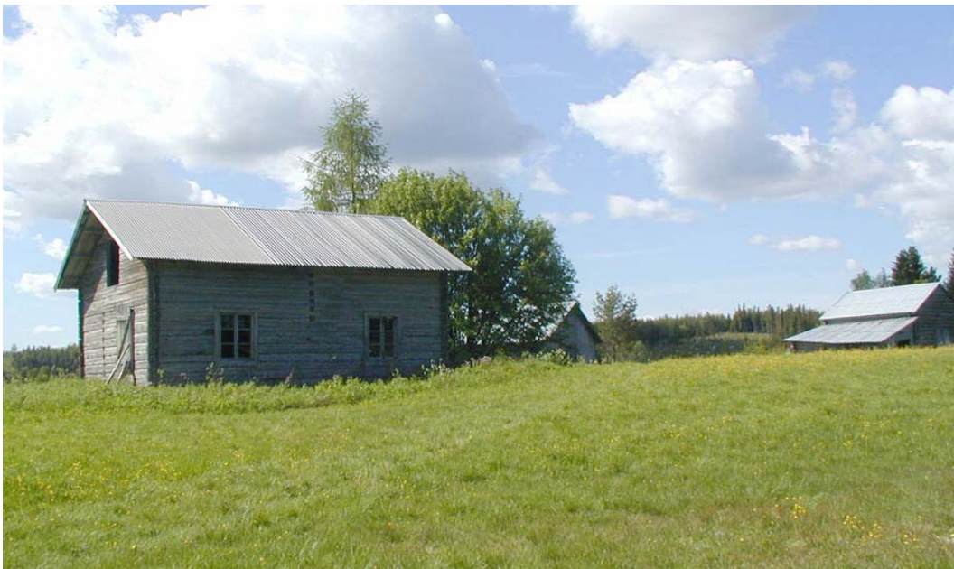
Västisvedjan, Foto Ånge kommun, Jonsson o Ullstein

Västisvedjan består av tre jordbruksfastigheter från 1800talets slut och 1900talets första hälft. Till gårdsanläggningarna hör mangårdsbyggnader varav en helkorsbyggnad och två byggnader från 1930-talet, den ena med brutet tak. Rester av timrade uthusbyggnader finns kvar inom området. Området är delvis vid god hävd.