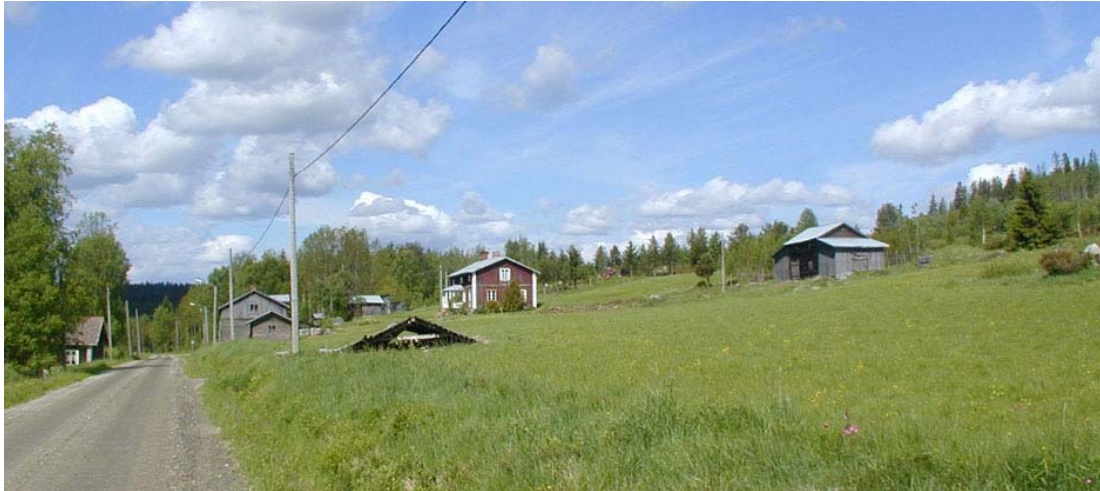
Grundsjön, norra sidan om Gårdsjön