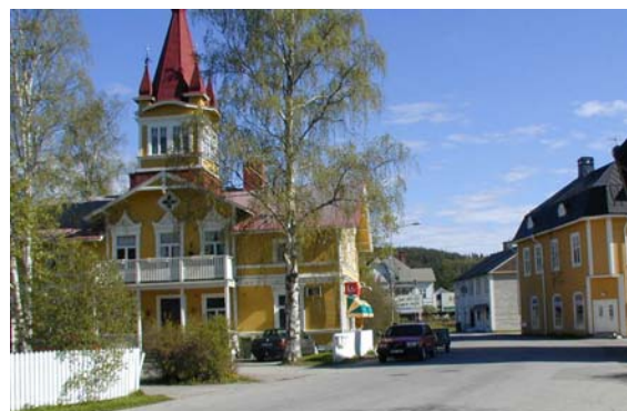
Köpmangatan med minilivsaffären Gluggen i Ånge

En mindre miljö med flerfamiljshus ligger öster om centrum vid kv Konvaljen. Byggnaderna är uppförda under första halvan av 1900-talet. Strax öster om kvarteret konvaljen finns en större miljö med ett 20-tal egnahemshus uppförda vid mitten av 1900-talet. Byggnaderna är i en våning med fasader i locklist och modernare lockpanel.