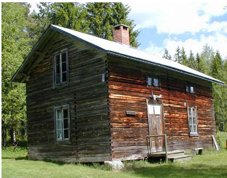
Enkelstuga från 1773 i Jättensjö, sydvästra Torp

Den västra gården består av en enkelstuga. En ladugård och en loge. Enkelstugan är intressant. Den är stor och har årtalet 1773 inristat på två väggar. Stugan är flyttad och omknutad i början av 1900-talet. Till den östra gården hör en mangårdsbyggnad från 1936, födorådsbyggnad, timrad halv Korsbyggnad, bagarstuga, ladugård och logar.