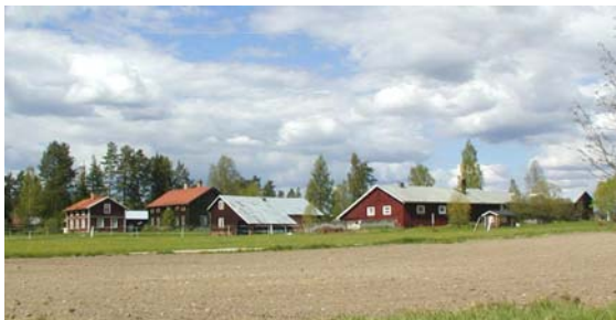
Boltjärn, Foto: Ånge kommun Jonsson o Ullstein

Boltjärns by är ett utmärkt exempel på en bevarad agrar bebyggelsestruktur och har i hög grad bibehållit sin 1800-tals karaktär vad gäller bebyggelsen. Byn består av ett flertal gårdsanläggningar med mangårdsbyggnader, ekonomibyggnader, stall och ladugårdslängor väl samlade runt en gårdsplan. Kors- och salsbyggnader är vanliga. Här finns också enstaka enkelstugor och parstugor bevarade. Nedanför den högt belägna byn breder odlingslandskapet ut sig. I dalgångens låga parti finns en kanal.