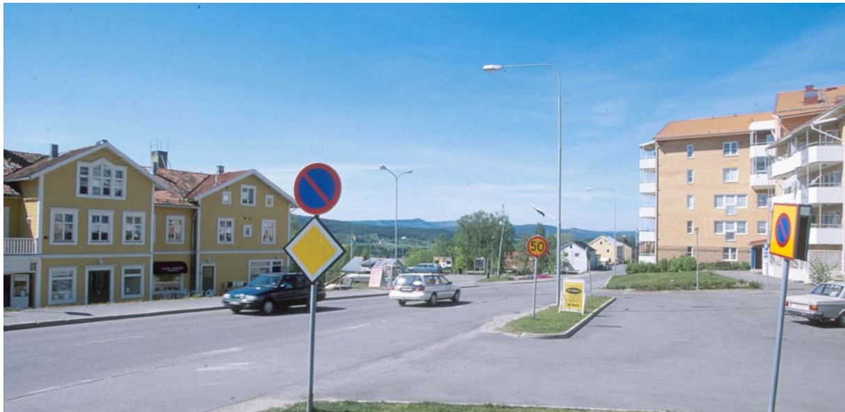
Gammal och ny bebyggelse i Fränsta centrum

En annan del omfattas av Ålsta Folkhögskola med omgivande bebyggelse. Skolan som grundades 1872 består bl.a. av en vitmålad salsbyggnad. Dessutom finns bostadsannex och ekonomibyggnader. Miljön är intakt dock med lite olika ålder och förändringar. Den tredje miljön ligger vid kyrkan och består förutom den av den gamla prästgården, samt en välbevarad sekelskiftebyggnad i väster.