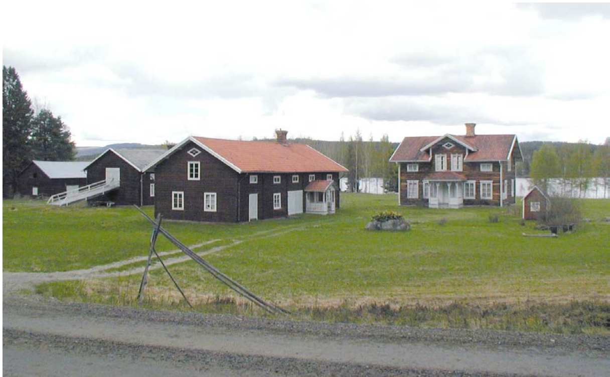
Fastigheten Ön 3:5

11 mål. Körvägen mellan Ytterturingen och Ön byggdes som beredskapsarbete på 1890-talet. Inom området har tidig järnmalmsutvinning förekommit. Därav namnet Järnmyran som ligger strax väster om bykärnan. Inom området finns också två blåsterugnar och ett stenröse.