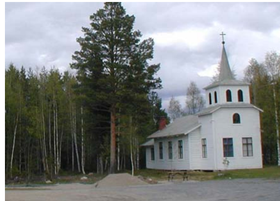
infart från väster Missionskyrkan