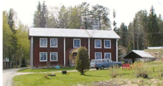
Hus på väg mot Vassnäs i Mosillre, från 1779, har varit gästgiveri

Jordbruksbebyggelsen ligger i allmänhet samlad efter vägen mot Vassnäs. Bebyggelsen avgränsas av skog i norr och av mindre tegar tidigare odlingsmarker i söder. Bebyggelsen är homogen. Här finns en kringbyggd gård med mangårdsbyggnad, en parstuga, från slutet av 1700-talet. Västerut finns två gårdar med ekonomibygnader bevarade. Byggnaderna är timrade, rödmålade med tegel- och plåttak. Den ena mangårdsbyggnaden- en korsbyggnad har en ljusmålad panel. Den andra är yngre och uppförd under 1940-talet. Åt öster finns flera mindre jordbruksfastigheter uppförda i början av 1900-talet, och en 30-talsvilla med brutet tak och fasaddekorationer. Området hotas av igenbuskning och endast ett fåtal tegar hävdas. En stor del av förklaringen är att flera hus används som fritidshus.