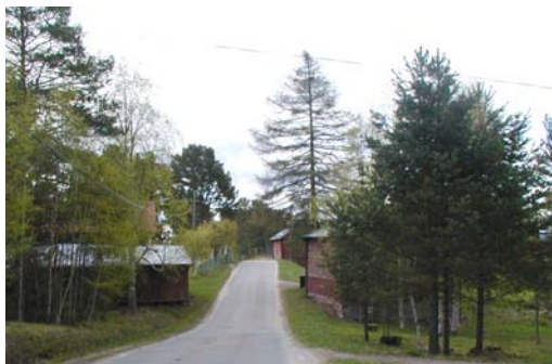
Utfarten från Byberget,

Bebyggelsen är belägen vid Bysjöns nordöstra strand och vid Bybergets västra sida. I byns centrala delar finns äldre jordbruksbebyggelse bestående av mangårdsbyggnader i salsplan och korsplan. Här finns också mangårdsbyggnader från 1900-talet. Vid byvägen står rödmålade logar samt några timrade ladugårdar med kammare.