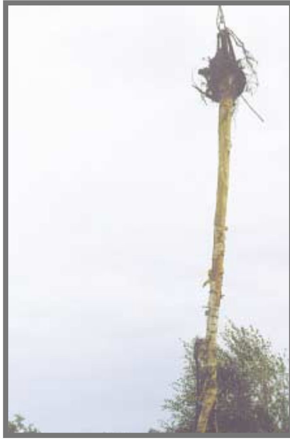
Många träd fick lyftas med hjälp av kran.