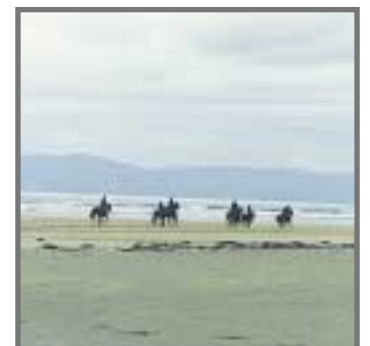
Att få galoppera på stranden var en härlig upplevelse.

Nu när vi är hemma så ska vi stå till förfogande till alla som funderar på att åka dit, som Sten kallar oss Ambassadörer. Vi ska tala om vad vi tycker om utbildningen och hur vi upplevde människorna där. Vi tycker alla att vi blev väldigt bra behandlade, människorna där är väldigt gästvänliga. Där vi bodde så var det en liten tjej som grät när vi skulle åka. Så jag kan