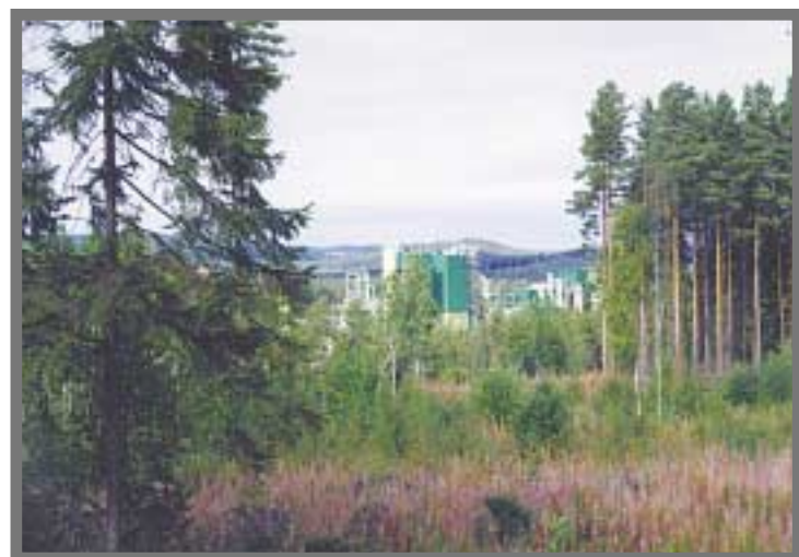
Eka Chemicals fabrik i Alby.

• Vilken information behöver/vill de tilltänkta slutanvändarna ha? • Var finns informationen idag och hur kan den lyftas in