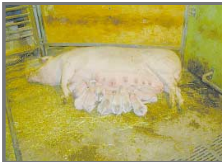
I en rymlig box bor suggan med sina kultingar.

- Och vad skulle jag göra med gödseln om jag inte kunde sprida den på mina åkrar? Det är en begränsad tid, vår och höst, som det är problem med odörer från jordbruket. Men kött och spannmål får vi året om.